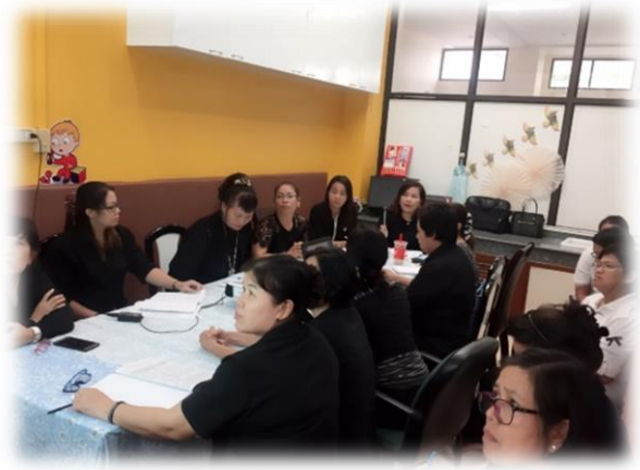
25 พฤศจิกายน 2560 จัดทำพิธีลงนามคำรับรองการปฏิบัติราชการ