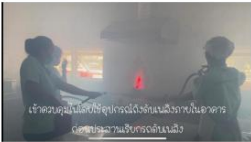
ผู้ดูแลเด็กใช้ดึงลิ้นแข็งเพื่อควบคุมเหตุเบื้องต้น