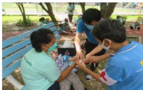
ปฐมพยาบาลเบื้องต้นสำหรับเด็กที่ได้รับบาดเจ็บ