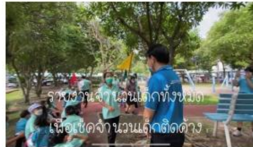
รายงานจำนวนเด็กเพื่อเช็คเด็กที่ติดค้าง