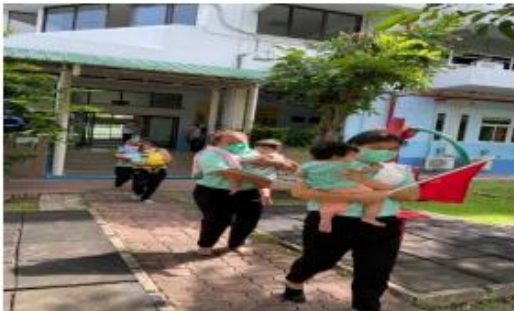
ผู้ดูแลเด็กพาเด็กปฐมวัยอพยพไปยังจุดรวมพล