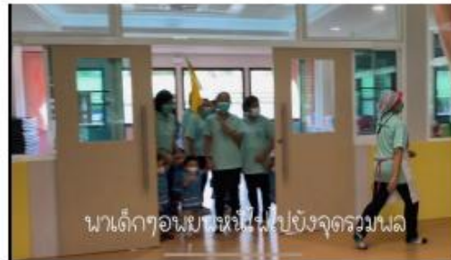
ผู้ดูแลเด็กพาเด็กปฐมวัยอพยพไปยังจุดรวมพล