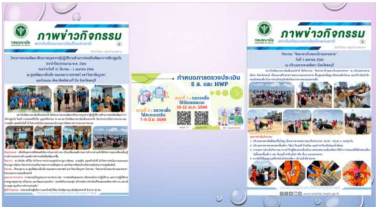
มติดีที่ประชุม ที่ประชุมรับทราบ