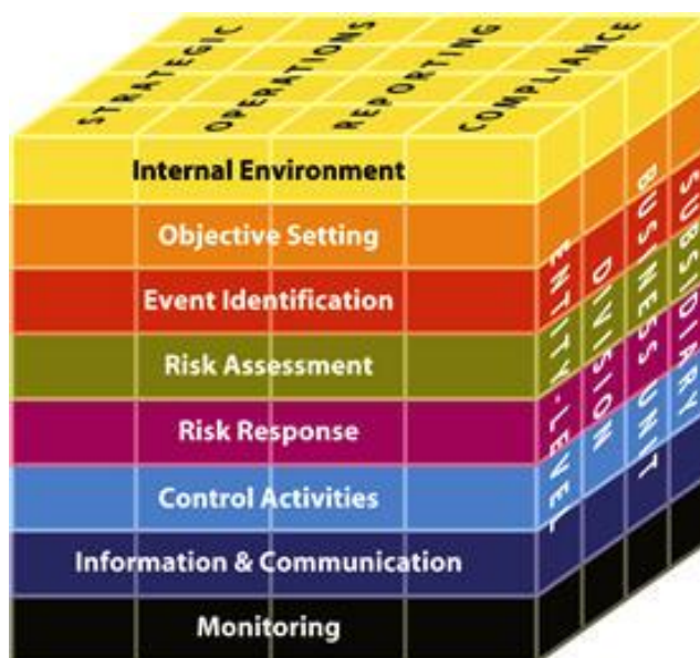
ภาพที่ 1 มาตรฐาน COSO (Committee of Sponsoring Organization Of The Tread Way Commission)